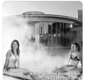
Kaiser Therme Bad Abbach

Immer schon nutzen die Menschen heilkräftiges Thermalwasser, um gesundheitliche Beschwerden zu lindern, präventiv vorzubeugen oder die Gesundheit aufrechtzuerhalten. Das Bayerische Golf- und Thermenland profitiert dabei von einem natürlichen Standortvorteil: Alle Bäder werden ganzjährig mit der ortseigenen Quelle gespeist, wodurch keine weitere Energie aufgewendet werden muss. Das natürliche Thermalwasser sprudelt aus Quellen in einer Tiefe von bis zu 2.000 Metern