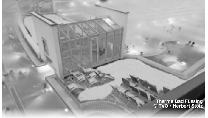
Therme Bad Füssing

Sieben Thermen in fünf Heil- und Thermalbädern stehen für nachhaltige Entspannung im Bayerischen Golf- und Thermenland. Sie sind Orte für nachhaltige Entspannung und Auszeit. Wissenschaftlich belegt hilft Heilwasser bei Rheuma, Verdauungs-, Stoffwechsel- und Wirbelsäulenproblemen ebenso wie bei Stress, Schlaflosigkeit oder Mattigkeit. Demnach ist Winter nicht nur Wellnesszeit, sondern auch Zeit, die eigene Gesundheit wieder ins Gleichgewicht zu bringen. Ob in Bad Füssing, Bad Griesbach, Bad Birnbach, Bad Gögging oder Bad Abbach – im Bayerischen Golf- und Thermenland wird die richtige Balance zwischen Gesundheit und ganzheitlichem Vital- und Aktivurlaub gelebt.