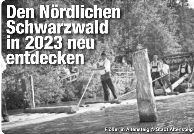
Flößer in Altensteig

Ob Wandern, Radfahren, aktiv sein oder entspannen – im Nördlichen Schwarzwald gibt es für alle Bewegungshungrigen, Entdecker, Genießer und Abenteurer das ganze Jahr über viel zu erleben. Zertifiziert als nachhaltiges Reiseziel, sind viele Ausflugsziele oder Wanderwege im Nördlichen Schwarzwald dank der guten ÖPNV-Anbindung, den E-Leihmobilen und den „Erlebnislinien“ – den regionalen Bus- und Bahnlinien – ganz einfach