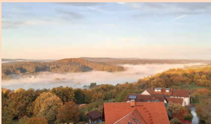
Foto: Blick Richtung Pfaffendorf/Maroldsweisach

Gerne können Sie weiterhin Ihre schönsten Eindrücke aus dem Gemeindegebiet per Foto festhalten und uns an kanzlei@maroldsweisach.de schicken. Bitte geben Sie in der E – Mail an, dass Sie die Bildrechte Ihres Bildes zur Veröffentlichung im Amtsblatt und auf der Homepage zustimmen.