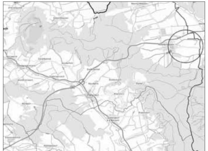
Abb. Übersicht Lage des Vorhabens

Die Fläche soll im Flächennutzungsplan als Sondergebiet für erneuerbare Energien nach § 5 Abs. 1 BauGB und Fläche für Maßnahmen zum Schutz zur Pflege und zur Entwicklung von Natur und Landschaft gem. § 5 Abs. 2a BauGB dargestellt werden.