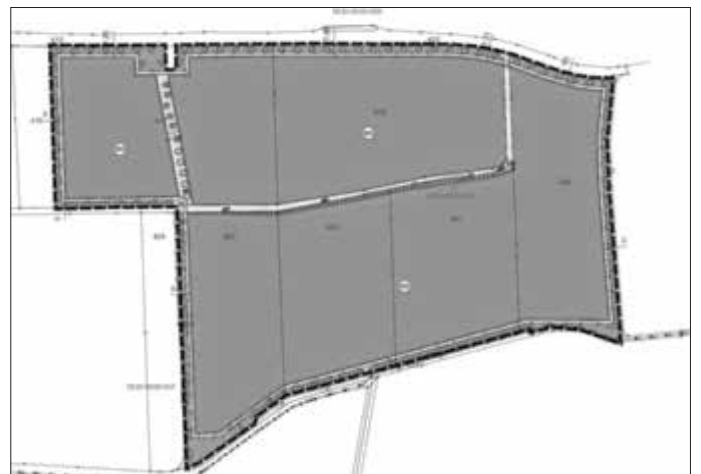
Abb. Geltungsbereich des Vorhabens (ohne Maßstab)

Die Lage und Abgrenzung sind aus dem nachfolgenden Kartenausschnitt ersichtlich (maßstabslos).