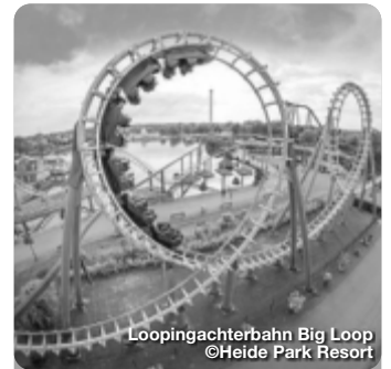
Loopingachterbahn Big Loop

Auf Schloss Thurn hetzt man nicht von einer Attraktion zur nächsten. Im Erlebnispark Schloss Thurn lautet das Motto: „Miteinander den Tag erleben“ Neben dem Erlebnis ist uns vor allem auch der Erholungswert wichtig, so dass der Aufenthalt bei uns zu einem abwechslungsreichen Gruppenerlebnis für Familien, Kinder, Schüler, Paare und Großeltern wird. Neben zahlreichen Attraktionen und Fahrgeschäften finden Sie bei uns auch Entspannungs-Zonen, in denen Sie zur Ruhe kommen. Schlossplatz 4, Heroldsbach