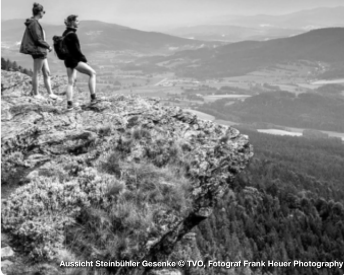
Aussicht Steinbühler Gesenke