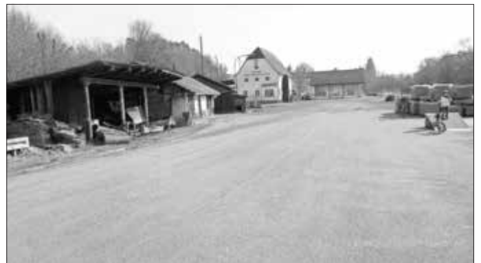
In diesem Bereich der Bahnhofstraße, links vor dem Bauhof (Hintergrund), soll das neue Feuerwehrhaus für Maroldsweisach errichtet werden.