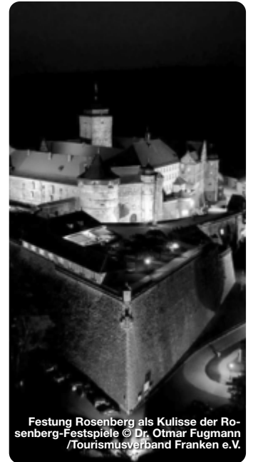
Festung Rosenberg als Kulisse der Rosenberg-Festspiele