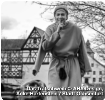
Das Tratschweib © AHA Design, Anke Hartenstein / Stadt Ochsenfurt