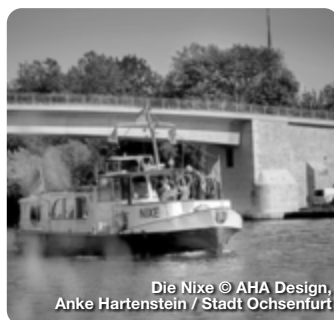
Die Nixe © AHA Design, Anke Hartenstein / Stadt Ochsenfurt