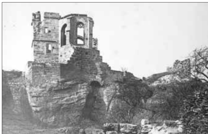
Die ehemalige Schlosskapelle der Altensteiner Burg um 1910. Ansicht von Süden.