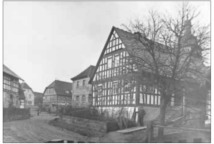
Der Kernort von Hafenpreppach ist um 1910 von Fachwerk- und Sandsteinbauten geprägt. Im Hintergrund die Kirche.

Der Bildband des Bezirksamtes mit seiner Beschreibung als auch die Fotosammlung des Apothekers Franz Gros sind aus kunsthistorischer und archivalischer Sicht als äußerst wertvoll einzuschätzen. Hier wäre mittelfristig eine konservatorische Behandlung der Original-Einbände wünschenswert. Darüber hinaus wäre eine Kopie (Faksimile) derselben mittels moderner Technik anzustreben.