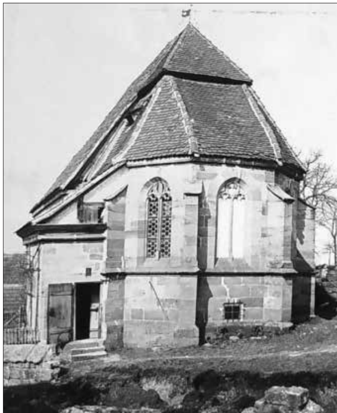
Die baufällige Altensteiner Kirche aus dem Jahr 1561 musste einem Neubau (1910) weichen.