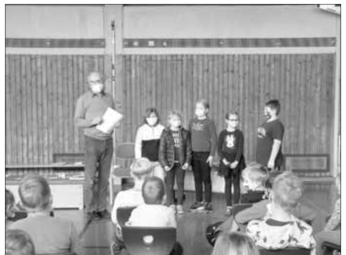
Die eifrigsten Leser beim Sommerferien - Leseclub im Schulort Pfarrweisach.