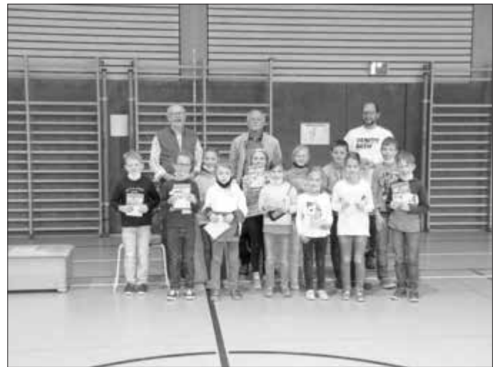
Die Gewinner der Grundschule Maroldsweisach im Schulort Maroldsweisach.

Bei dieser großen Lesebegeisterung in den Ferien verwundert es nicht, dass sich die Schüler und viele Eltern auch für das nächste Jahr wieder einen „SOMMERFERIEN-LESECLUB“ in den beiden Büchereien und an der Grundschule Maroldsweisach wünschten.