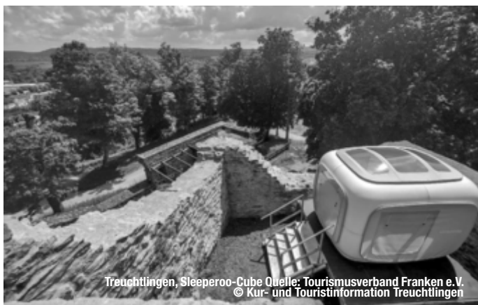
Treuchtlingen, Sleeperoo-Cube

Eine Burg-Übernachtung der mystischen Art bietet die Thermenstadt Treuchtlingen. Der Schlaf-Cube der Firma sleepero ermöglicht auf der Treuchtlinger Burgruine eine Übernachtung, die so bisher nicht vorstellbar war. Die kleine Schlafkabine thront inmitten der historischen Gewölbe der Ruine. Die Gäste fühlen sich so wie im 12. Jahrhundert. Dank dreier großer Panoramafenster und eines transparenten Dachs genießen sie eine herrliche Aussicht und schlafen unterm Sternenhimmel. Der Schlaf-Cube ist mit nachhaltigen Materialien ausgestattet, wie einer 1,60 auf 2 Meter großen Sojaöl-kernmatratze sowie kuscheliger Bettwäsche aus Schafschurwolle oder Bambus. Auch bei der „Chillbox“, die mit Bio-Snacks und Getränken sowie allerlei Nützlichem für die Nacht bestückt ist, wurde auf nachhaltiges Material und Produkte geachtet. Die Cubes selbst werden aus zu 100 Prozent recyclefähigem Kunststoff in Deutschland gefertigt. Mit der besonderen Übernachtung ist es aber nicht getan: Auf Entdeckungstour finden die Gäste im Burghof die alte Zisterne und die ziegelgepflasterte Herdplatte der alten Burgruine. Wanderer und Mountainbiker kommen beim Burgberg und seinen tief ins Tal fallenden Hängen auf ihre Kosten – der nahegelegene Trailpark „Heumöden-trails“ reizt Abenteuerer und Naturgenießer..