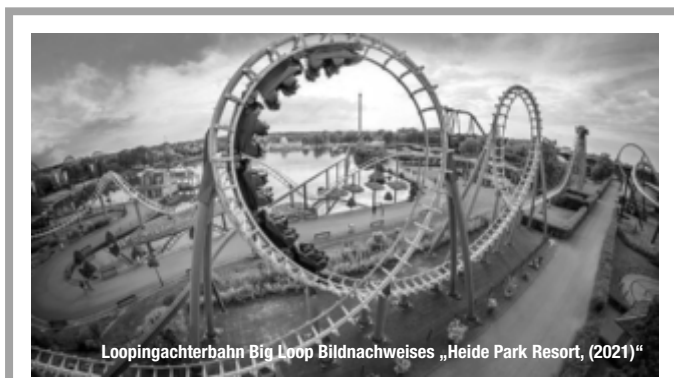
Loopingachterbahn Big Loop

häusern. Im schönsten und prächtigsten Fachwerkhaus der Stadt lebten die weltbekanntesten Brüder Grimm. Im früheren Amtshaus und heutigen Museum Brüder Grimm-Haus verbrachten Sie ihre glückliche Kindheit. treffpunktDeutschland.de/steinau-an-der-strasse