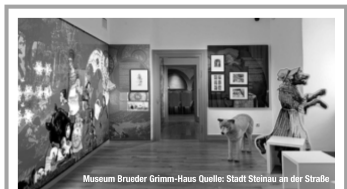
Museum Brüder Grimm-Haus