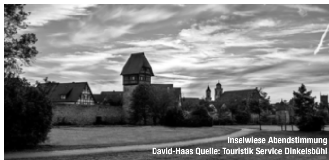
Inselwiese Abendstimmung David-Haas

Bereits von Ferne zeichnet sich die Silhouette der Stadt mit dem mächtigen Münster St. Georg ab. Türme und Tore umgeben eine der „am besten erhaltenen mittelalterlichen Städte Deutschlands“, wie Kunsthistoriker sagen. Ein Wochenmagazin kürte die Altstadt sogar zur schönsten im Lande: ein Geheimtipp und „Zeitreiseziel“ so die Redaktion. Andere finden hier ihren „Traumort“, wie das Magazin GEO. treffpunktdeutschland.de/dinkelsbuehl