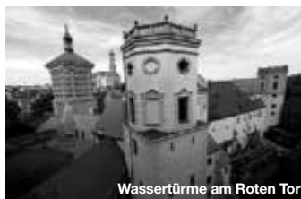
Wassertürme am Roten Tor