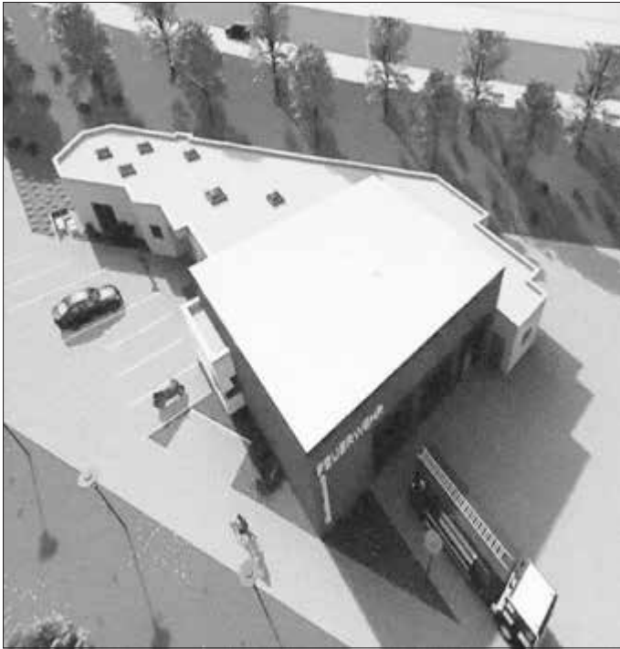
So könnte das neue Feuerwehrgaragehaus für Maroldsweisach neben dem Bauhof der Gemeinde, westlich der B 279, einmal aussehen.