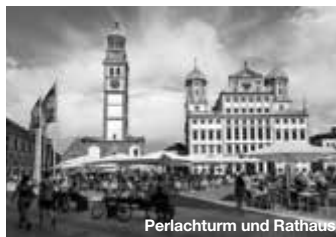
Perlachturm und Rathaus

„Augusta Vindelicum“ nannten die Römer ihre Zivilsiedlung zwischen Lech und Wertach. Daraus wurde später Augsburg, das als freie Reichsstadt im 15. und 16. Jahrhundert durch den Fernhandel und die Bankgeschäfte hier ansässiger Kaufmannsfamilien, vor allem der Fugger und Welser, zu den Weltstädten der Renaissance zählte. Noch heute erzählen viele schicke Gebäude von der historischen Bedeutung Augsburgs, der ältesten Stadt Bayerns. Allen voran das Renaissance-Rathaus mit seinem Goldenen Saal und dem Perlachturm.