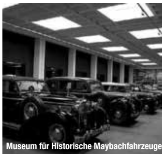
Museum für Historische Maybachfahrzeuge

Fränkische Dreiflüssestadt – so kennen die meisten Gemünden. Sinn und Fränkische Saale münden hier in den Main. Im Stadtteil Wernfeld fließt noch ein vierter Fluss – die Wern – in den Main, so dass auch von der Vierflüssestadt gesprochen wird. treffpunktdeutschland.de/gemuenden