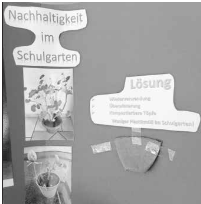
Plakat - Das Plakat der „Schulgärtner“ wirbt für Nachhaltigkeit im Schulgarten und bietet bestimmte Lösungen an.