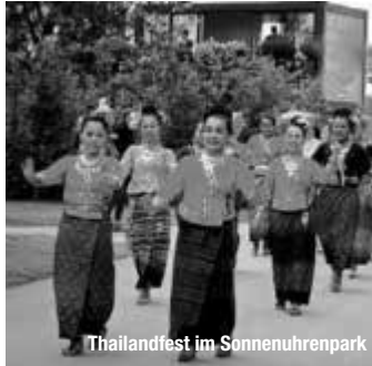
Thailandfest im Sonnenuhrenpark