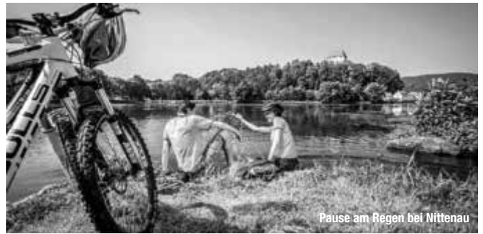
Pause am Regen bei Nittenau