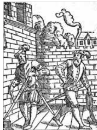
Abbildung: Zwei Scharfrichter mit Richtschwert und Strick bei der Vorbereitung einer Hinrichtung (1562);