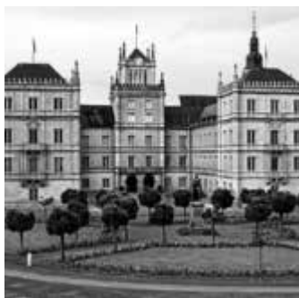
Schloss Ehrenburg treffpunktdeutschland.de/coburg