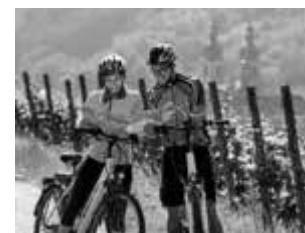
Radler im Weinberg