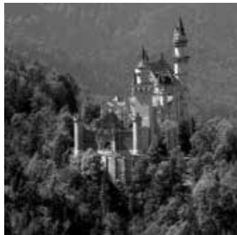
Schloss Neuschwanstein treffpunktdeutschland.de/fuessen