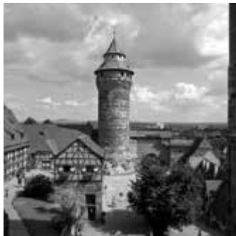
Kaiserburg Nürnberg treffpunktdeutschland.de/nuernberg