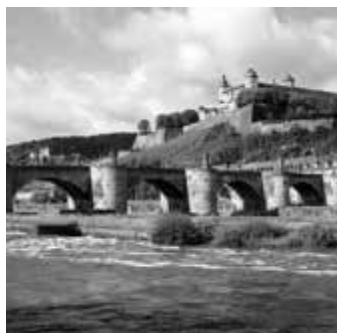
Festung Marienberg treffpunktdeutschland.de/wuerzburg