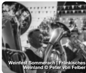
Weinfest Sommerach | Fränkisches Weinland

Im Lieblichen Taubertal kommen Wanderer zum Beispiel auf dem rund acht Kilometer langen „Tauberschwarz Wanderweg“ einer alten Regionalsorte auf die Spur: Die Rebsorte Tauberschwarz, aus der unkomplizierte, fruchtige Weine gekeltert werden, darf nur hier angebaut werden. Und in Bamberg dient ein neues Informationszentrum als Ausgangspunkt für einen