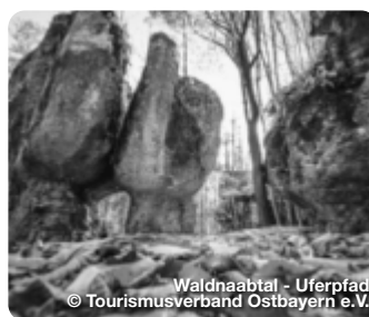
Waldnaabtal - Uferpfad

Beindruckende Landschaften von Naturgewalten erschaffen. Die Jura-Landschaft ist ein Kind des Wassers, die Schöpfung eines riesigen Meeres, das einst im Erdmittelalter, zu Zeiten der Dinosaurier, die Region zwischen Sulzbach-Rosenberg und Kelheim im Naturpark Altmühltal bedeckte. Nach dem Rückzug des Jurameeres blieben große Mengen an Ablagerungen aus Schwämmen, Schnecken und anderen Kleinstlebewesen zurück, die im Laufe von Millionen Jahren zum jura-typischen Kalkstein wurden. Wind und Wasser formten die entstandenen Hochflä- chen um, zurück blieben sanft gewellte Hochebenen, überragt von Kuppen und Kegeln, gegliedert durch enge eingeschnittene Flusstäler. TreffpunktDeutschland.de/bayerischer-jura