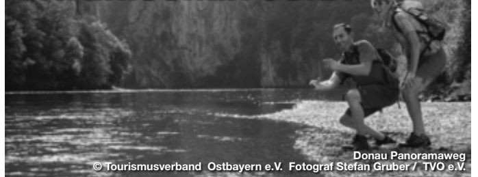
© Tourismusverband Ostbayern e.V. Fotograf Stefan Gruber / TVO e.V. Donau Panoramaweg

Beindruckende Landschaften von Naturgewalten erschaffen. Die Jura-Landschaft ist ein Kind des Wassers, die Schöpfung eines riesigen Meeres, das einst im Erdmittelalter, zu Zeiten der Dinosaurier, die Region zwischen Sulzbach-Rosenberg und Kelheim im Naturpark Altmühltal bedeckte. Nach dem Rückzug des Jurameeres blieben große Mengen an Ablagerungen aus Schwämmen, Schnecken und anderen Kleinstlebewesen zurück, die im Laufe von Millionen Jahren zum jura-typischen Kalkstein wurden. Wind und Wasser formten die entstandenen Hochflä- chen um, zurück blieben sanft gewellte Hochebenen, überragt von Kuppen und Kegeln, gegliedert durch enge eingeschnittene Flusstäler. TreffpunktDeutschland.de/bayerischer-jura