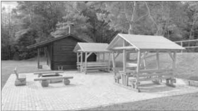
Eines von 38 Regionalbudget-Projekten aus den Jahren 2020 und 2021 ist der Zeltplatz in Dürrenried, der durch Sitzgelegenheiten und eine Feuerstelle aufgewertet wurde.