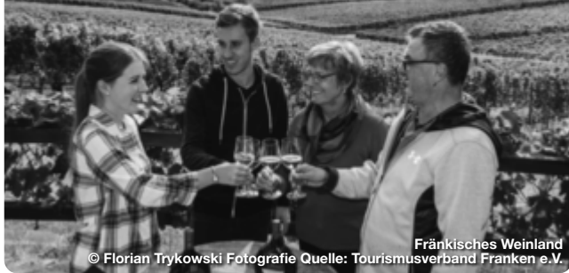
© Florian Trykowski Fotografie Quelle: Tourismusverband Franken e.V. Fränkisches Weinland