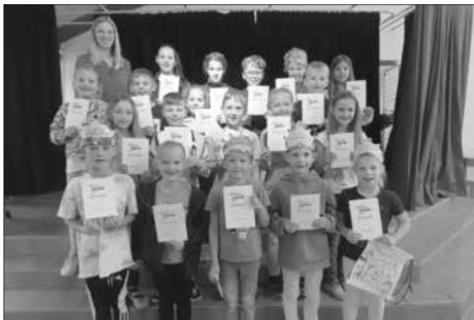
Ehrungen in Maroldsweisach