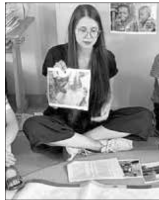
Die Kinder lernen, wie Kakao angebaut und geerntet wird

Grundschulen und Kindertagesstätten der Baunach-Allianz, die Interesse am Workshop haben, können sich gerne bei Laura Späth melden (laura.spaeth@eborn.de oder 09531-62960). Die Workshops werden gefördert durch Engagement Global mit ihrer Servicestelle Kommunen in der Einen Welt mit Mitteln des Bundesministeriums für wirtschaftliche Zusammenarbeit und Entwicklung und sind deshalb komplett kostenfrei. Ziel der Workshops ist es nicht nur, die Kinder über den fairen Handel aufzuklären, sondern auch die Schulen und Kindertagesstätten zu einer verstärkten Orientierung am fairen Handel zu motivieren.