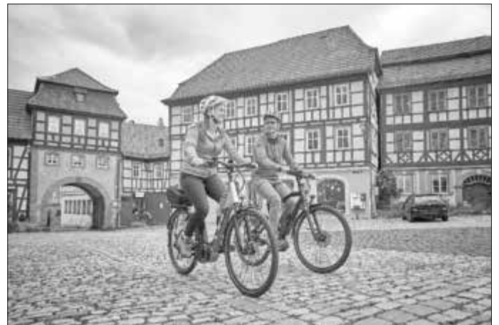
Mit dem Rad unterwegs auf der Deutschen Fachwerkstraße

Die Karte ist unter www.shop.hassberge-tourismus.de bestellbar und bei den Tourist-Infos der Mitglieder erhältlich. Weitere Informationen gibt es auf der Website von Haßberge Tourismus e.V. unter www.hassberge-tourismus.de/erleben/sehenswert/deutsche-fachwerkstrasse .