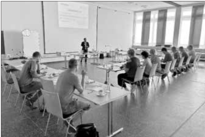
Die Grundlagenschulung zur fairen Beschaffung in der Frauengrundhalle Ebern

Die Fähigkeiten, die in der Grundlagenschulung und dem Praxismodul erlernt wurden, sollen nun vermehrt im Arbeitsalltag eingesetzt werden. So wollen die Kommunen der Baunach-Allianz zunehmend fair und nachhaltig beschaffen. Zudem wird es weitere Fortbildungsmöglichkeiten im Bereich faire und nachhaltige Beschaffung geben.