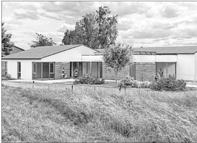
Der Planungsentwurf der Kindertagesstätte Maroldsweisach fand im Gemeinderat Zustimmung. (PDF: Michael Glodschei)

Für die Sanierung des Feuerwehrhauses in Geroldswind vergab der Gemeinderat die Gewerke. Die Erdverkabelung und Erneuerung der Straßenbeleuchtung in Marbach übernimmt die Firma Bayernwerk für 20.652 Euro.