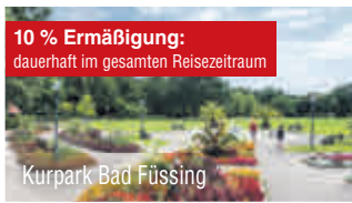
Kurpark Bad Füssing