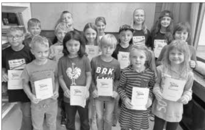
Ehrungen in Pfarrweisach