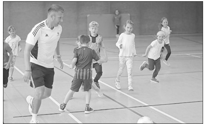
Trainer: Einmal mit dem bzw. gegen den Trainer Fußballspielen – ein Highlight im Schulbolzer-Projekt.

Das Schulbolzer-Projekt fand in Kooperation mit dem Sportclub Maroldsweisach 1946 e. V. statt und wird größtenteils vom Bundesministerium für Familie, Senioren, Frauen und Jugend im Rahmen des Bundesprogramms „Demokratie leben!“ gefördert. Die Restkosten konnten durch Spenden der Firma Stehimpuls GbR und des Busunternehmens Schnabel gedeckt werden, wofür die Grundschule Maroldsweisach auch an dieser Stelle ein herzliches Dankeschön ausspricht.