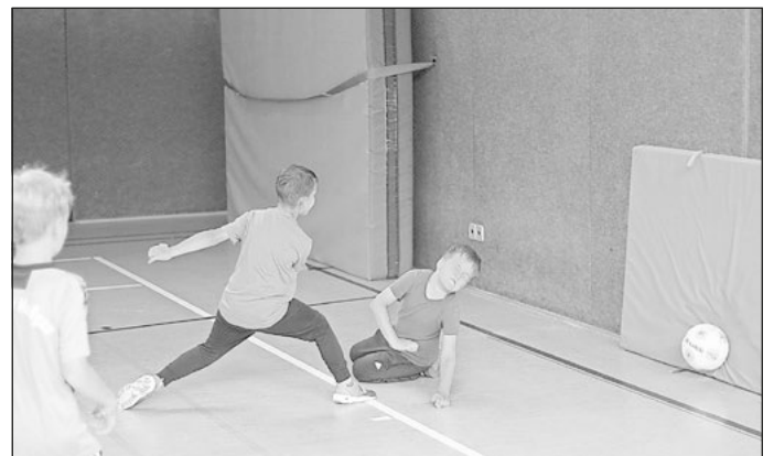
Torschuss: Völlig unhaltbar für den verdutzten Torwart traf der gegnerische Mitspieler ins „Netz“.