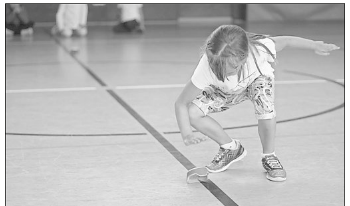
Geschicklichkeit: Möglichst viele leuchtende Punkte „auszulöschen“ war die entscheidende Aufgabe beim abschließenden Geschicklichkeitsspiel.