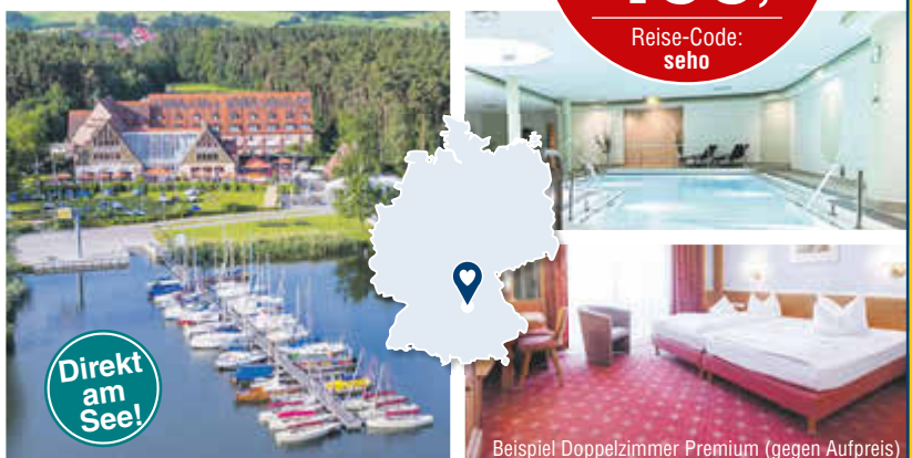
Beispiel Doppelzimmer Premium (gegen Aufpreis)