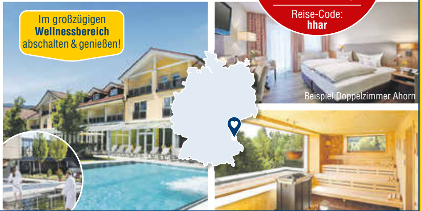
Beispiel Doppelzimmer Ahorn

Im großzügigen Wellnessbereich abschalten & genießen!