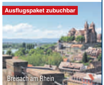
Breisach am Rhein

Ihr Hotel erwartet Sie nahe der deutsch-französischen Grenze und verfügt über ein Restaurant, eine Bar, eine Terrasse sowie Abstellmöglichkeiten für Fahrräder und Motorräder.