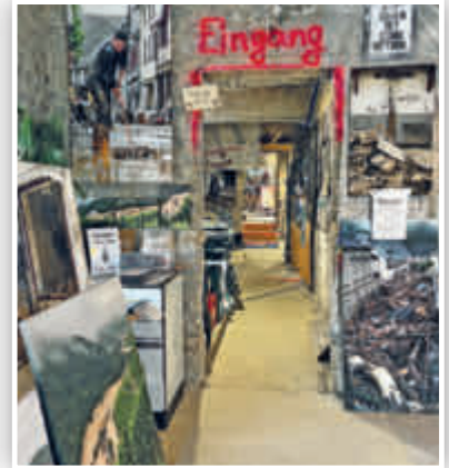
... die außer vielen Bildern auch mehrere Filmsequenzen beinhaltet.

AHRTAL. AFi. Auch fast zwei Jahre nach der verheerenden Flut ist das Ausmaß der Schäden entlang der Ahr weiterhin gegenwärtig. An vielen Stellen sieht es auf den ersten Blick noch immer nicht danach aus – doch es geht voran. Inhaber von Hotels, Restaurants und Geschäften haben, samt ihrer Mitarbeiter*innen, unzählige Stunden Arbeit, verbunden mit viel Hoffnung und Mut, in den Wiederaufbau ihrer geschäftlichen Existenzen gesteckt. Das Ziel: Endlich wieder zahlreiche Tages- und Übernachtungsgäste sowie Kundinnen und Kunden begrüßen zu können. Wanderfreudige Besucher*innen des Ahrtals dürfen sich, neben unvergesslichen Stunden in grandioser Natur entlang