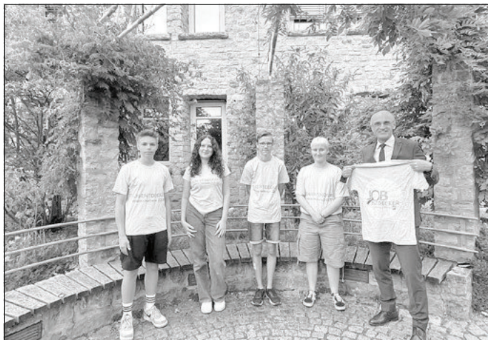
Das waren die vier Jobentdecker im Jahr 2023.

Jugendlichen ab 14 Jahren haben die Möglichkeit, sich für das Jobentdecker-Projekt des Landkreises Haßberge zu bewerben. In drei selbstgewählten Sommerferienwochen können die Teilnehmer jeweils drei Tage pro Woche drei verschiedene Arbeitgeber und Ausbildungsberufe kennenlernen, die von der Bildungsregion Haßberge vermittelt werden. Als Vergütung erhalten sie 500 Euro. Zusätzlich teilen sie ihre Erfahrungen auf Instagram, TikTok und der Jobentdecker-Webseite und informieren so andere Jugendliche über die vielfältigen beruflichen Möglichkeiten im Landkreis Haßberge. Die Bildungsregion stellt dafür ihre eigenen Social-Media-Kanäle zur Verfügung. Das Ziel des Projekts ist es, Jugendlichen, die noch unsicher über ihre berufliche Zukunft sind, Orientierung zu bieten und dem Fachkräftemangel in der Region entgegenzuwirken. Für 2024 werden insgesamt vier Plätze für diesen besonderen Ferienjob vergeben. Es wird darauf geachtet, den Jugendlichen eine breite Palette unterschiedlicher Berufsbilder vorzustellen.