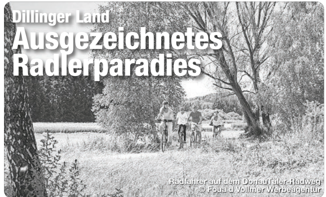
Radfahrer auf dem Donautaler-Radweg

Verschieden Straßenkünstler, Akrobaten, Jongleure und Clowns versprechen ein unterhaltsames Programm für die ganze Familie. Mehrere Bands sorgen für musikalische Unterhaltung und die Dillinger Vereine kümmern sich um das leibliche Wohl.