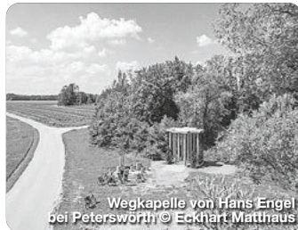
Wegkapelle von Hans Engel bei Peterswörth