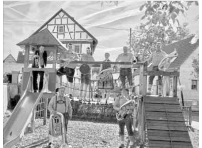
Die Blechvögel spielen im Diakonie-Biergarten auf dem Zeilberg.

Mit Blasmusik in den Sommer: dazu lädt die Diakonie Bamberg-Forchheim am Sonntag, 2. Juli 2023, auf den Zeilberg ein: „Die Blechvögel“ spielen ab 15:00 Uhr Blasmusik im Diakonie-Biergarten, Voccawind 45, Maroldswisach. Der Eintritt ist frei.