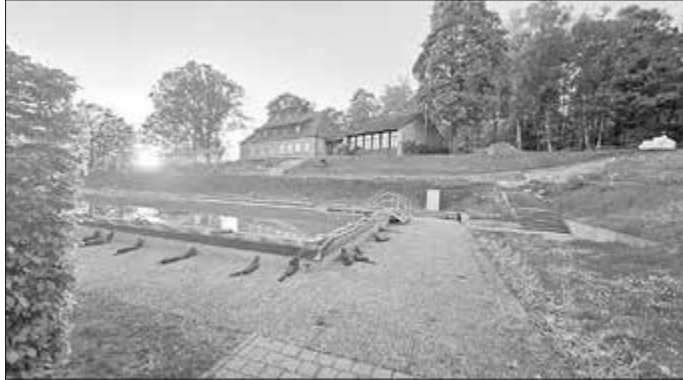
Das Freibad Altenstein wird saniert. Die Arbeiten haben begonnen. Hier geht die Sonne gerade unter und alle hoffen darauf, dass sie nach der Bauzeit wieder für die Badbesucher scheint.