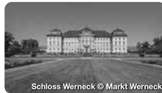
Schloss Werneck

Zum denkmalgeschützten Anwesen gehören neben dem beeindruckenden dreigeschossigen Renaissance-schloss mit Zehntgefängnis ein Innenhof, umgeben von einer mächtigen Scheune, Wirtschaftsgebäuden und mauergeschützten Gartenanlagen. Kirchberg 11, Oberschwarzach