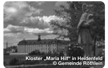
Kloster „Maria Hilf“ in Heidenfeld