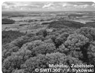
Michelau, Zabelstein

TreffpunktDeutschland.de/schweinfurt-region