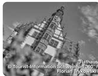
Rathaus Schweinfurt 360°