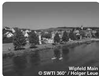
Wipfeld Main