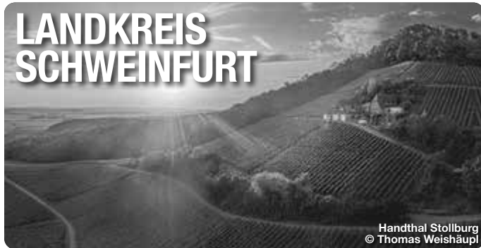
Handthal Stollburg

Alle Termine und Angaben unter Vorbehalt!